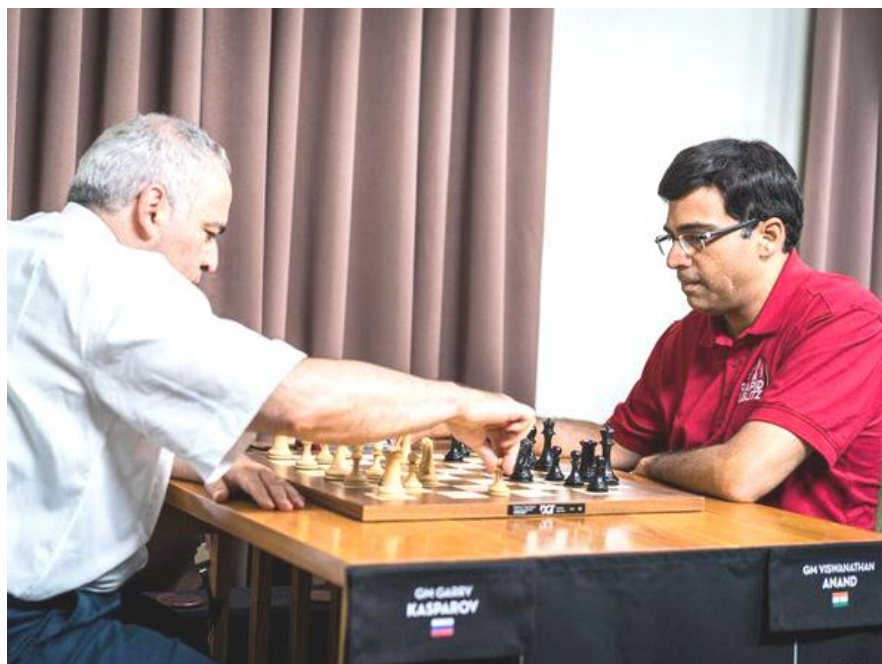
Garry Kasparov y Vishy Anand