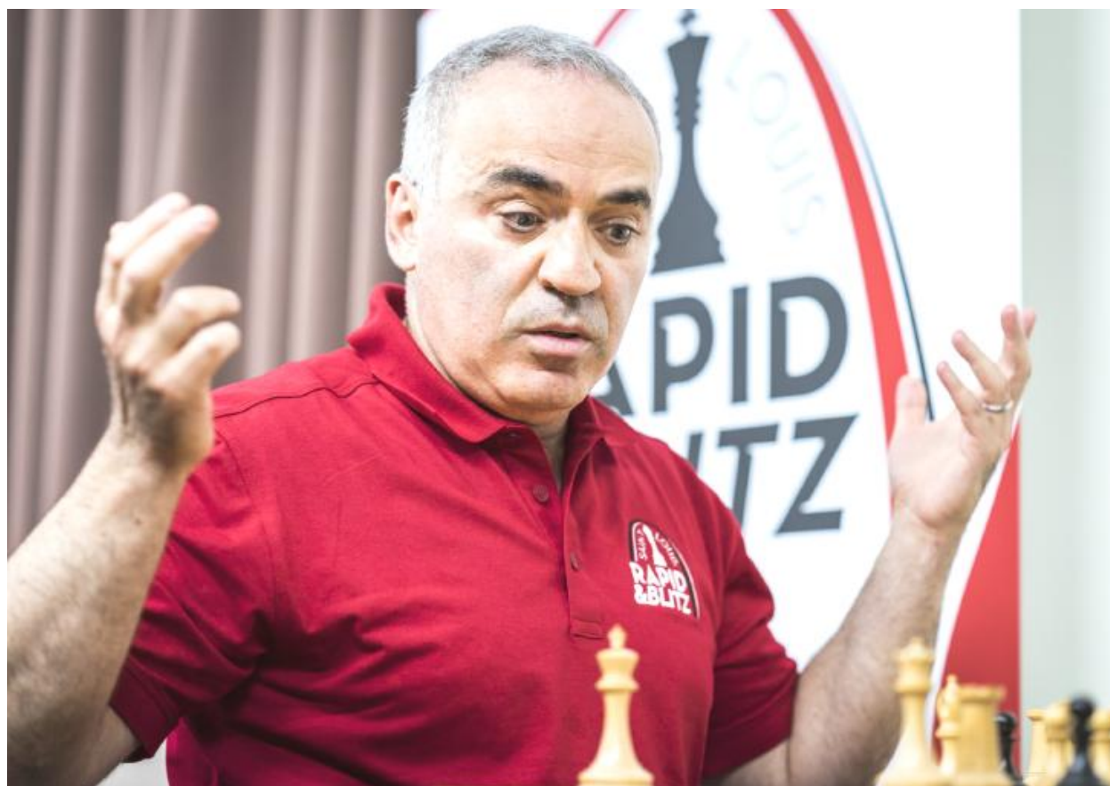
Gari Kaspárov, durante una de las partidas en San Luis

Gari Kaspárov ha superado dignamente en San Luis (EEUU) el durísimo reto de no ser vapuleado a los 54 años por las jóvenes estrellas. El excampeón perdió una sola partida en la última jornada, con tres victorias y cinco empates que le remontaron al 5º puesto del torneo relámpago y al 8º de la clasificación combinada, a medio punto del 5º. El armenio Levón Aronján ganó la Copa Sinquefield, y el ruso Serguéi Kariakin la modalidad relámpago.