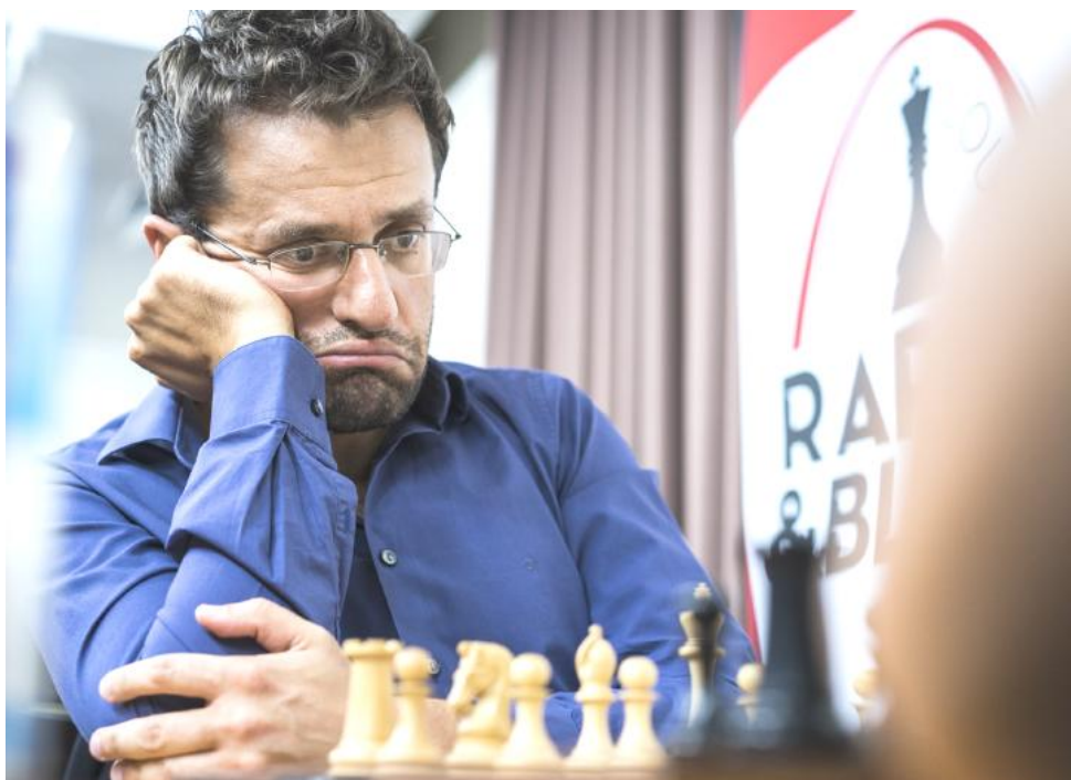
Levón Aronián, ganador de la clasificación combinada