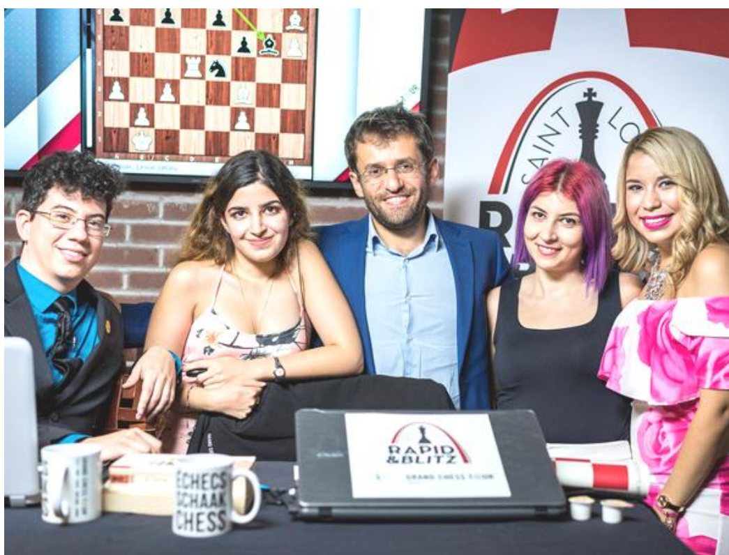
Levon Aronian con los comentaristas del torneo

Levon Aronian comenzó el día con tranquilidad y firmó unas tablas rápidas con Hikaru Nakamura. A continuación perdió contra David Navara. Eso permitió a Sergey Karjakin recortar la ventaja, pero Aronian resultó tener otro día muy fuerte. Ganó 4 partidas y empató en las 3 restantes. Sus rivales más cercanos no lograron estar a la altura.