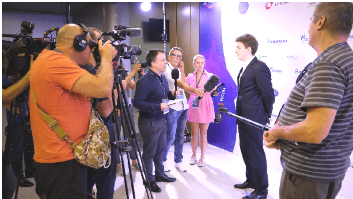
Jan-Krzysztof Duda sendo entrevistado após a vitória

Na verdade, vencer o torneio é uma questão totalmente diferente e pode ser considerada a melhor conquista de um jogador polonês na história do Xadrez. Sua vitória foi amplamente divulgada na mídia polonesa e ele imediatamente realizou uma série de entrevistas.