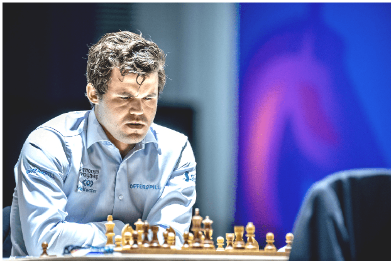
Magnus Carlsen estava com disposição para lutar.

Carlsen: "Meu oponente joga de tudo, por isso é difícil me preparar para ele. Eu estava apenas decidindo se deveria jogar uma partida tranquila ou ir para uma posição onde os três resultados fossem possíveis e finalmente decidi que já tinha jogado bastante partidas tranquilas neste torneio, e estando 1 a 0, pensei em jogar e ver o que poderia acontecer."