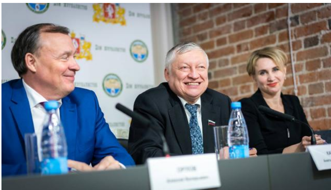
El excampeón Anatoli Kárpov, en el centro, durante la conferencia de prensa en Yekaterimburgo

Apenas unas horas antes de ese comunicado ministerial, el presidente de la Federación Internacional de Ajedrez (FIDE; engloba a 197 países) desde octubre de 2018, el ruso Arkady Dvorkóvich, presentó el Torneo de Candidatos en una conferencia de prensa en Yekaterimburgo junto a autoridades locales y con el célebre excampeón del mundo Anatoli Kárpov (ahora diputado del Parlamento de Rusia) como invitado especial. Dvorkóvich fue primer ministro adjunto en los mandatos de Vladímir Putin y de Dimitri Miedviédiev. Y en 2018 presidió el Comité Organizador del Mundial de Fútbol en Rusia. Ahora, además de la FIDE, preside el Centro de Innovación de Skólkovo, lo más parecido que hay en su país a Silicon Valley.