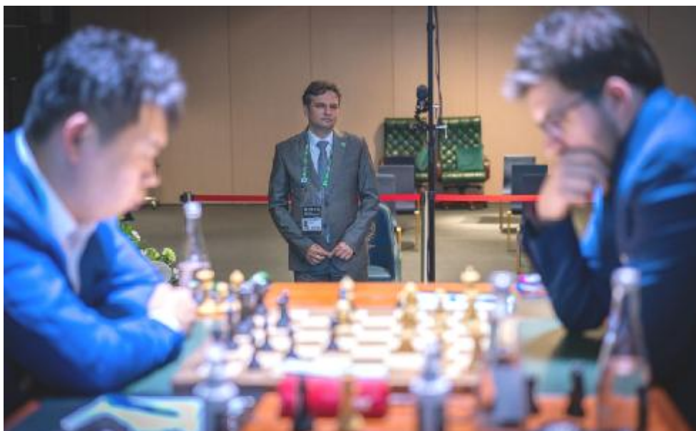
Ha terminado el torneo más "largo" de la historia