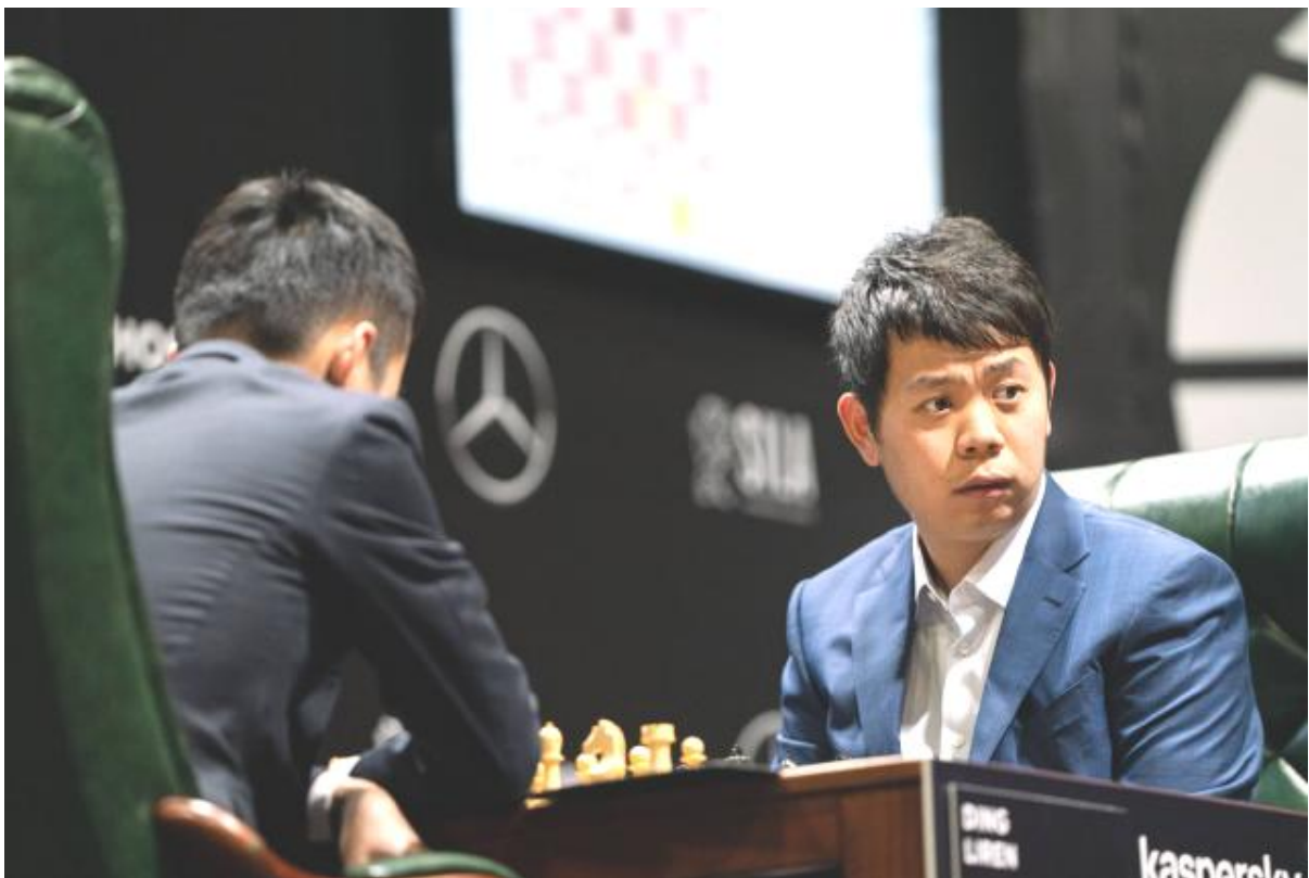
Hao Wang, al comienzo de la partida con su compatriota Liren Ding

Aún más dura fue la lucha entre el neerlandés Anish Giri y el ruso Ian Nepómniachi, quien se impuso tras cinco horas y media. Giri intentó sorprender con una profunda preparación casera en una línea muy aguda, pero no logró ventaja alguna. “Todo indica que Anish no previó la jugada 19 de las negras, y eso quiere decir que su preparación no fue buena, por muchas horas que invirtiera en ella”, comentó, en directo para Chess24.com, el campeón del mundo, el noruego Magnus Carlsen, quien defenderá su título frente al vencedor en Yekaterimburgo, probablemente en diciembre en Dubái (Emiratos Árabes Unidos).