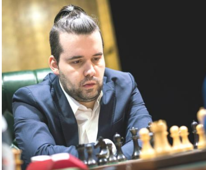
Ian Niepómniachi, al inicio de su partida de hoy frente a Fabiano Caruana

exactas para mantener su ventaja. Al mismo tiempo, Niepómniachi exhibió otro de los grandes cambios del ajedrez en el siglo XXI, debido al entrenamiento intensivo con computadoras: la tremenda mejora de la técnica defensiva. De modo que Caruana no solo fracasó en su intento de poner al ruso contra las cuerdas, sino que además quedó un poco peor tras el primer control de tiempo, tras 40 movimientos.