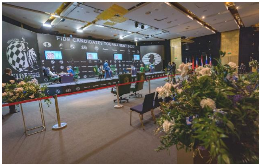
La sala de juego en Ekaterinburgo

En la quinta ronda, Ian Nepomniachtchi venció a Wang Hao y ha tomado el mando en solitario como primer jugador del torneo. Kirill Alekseenko y Maxime Vachier-Lagrave se plantearon una agresiva Najdorf que finalmente desembocó en un empate por triple repetición de jugadas. Anish Giri no consiguió en victoria una posición prometedor en su partida con Fabiano Caruana.