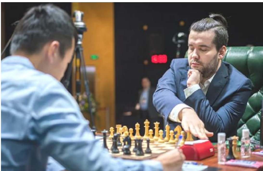
El comienzo del juego

Y eso permitió que el ruso le aplicase el veneno que había preparado minuciosamente en su laboratorio, demostrando a su vez que ese esquema produce serios problemas para las negras. Todo impecable -y de mérito enorme, dada la cantidad de horas de trabajo que implica- desde un punto de vista puramente científico. Pero quien pretenda demostrar que el ajedrez también es un deporte, además de ciencia y arte, lo tendrá muy difícil si toma como ejemplo esta partida.