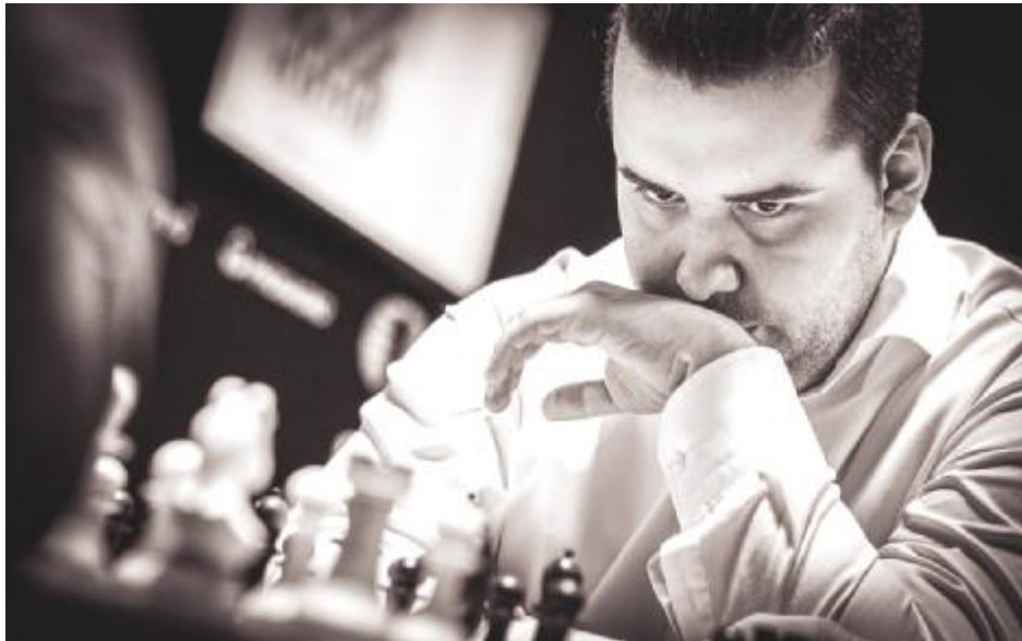
Ian Nepomniachtchi manda en solitario con 5,5/9 puntos

21/04/2021 – En la novena ronda del Torneo de Candidatos en Ekaterinburgo, Anish Giri derrotó a Wang Hao. En la clasificación eso significa que junto con Fabiano Caruana y Maxime Vachier-Lagrave (los tres tienen 5/9 puntos), es el más cercano perseguidor del actual líder, Ian Nepomniachtchi (5,5/9). Nepomniachtchi firmó tablas con las piezas negras en su partida con Alexander Grischuk. Las partidas Ding Liren vs. Vachier-Lagrave y Alekseenko vs. Caruana igualmente concluyeron en tablas.