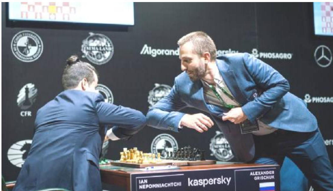
Saludo inicial en el duelo entre los dos rusos