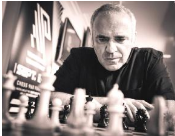
Gari Kasparov, durante un torneo de ajedrez 960 en San Luis (EEUU) en 2020

Quizá no haya nadie tan ducho en decidir la mejor estrategia en los momentos decisivos que Gari Kasparov, número uno del mundo desde 1985 hasta que se retiró, en 2005. El ruso, de 58 años, que ahora reside entre Estados Unidos y Croacia (y que volverá a jugar el torneo de ajedrez 960 en San Luis (EEUU) en septiembre, sostiene que el neerlandés Anish Giri se equivocó al arriesgar en plan suicida en la penúltima ronda del Torneo de Candidatos, en lugar de esperar a la última.