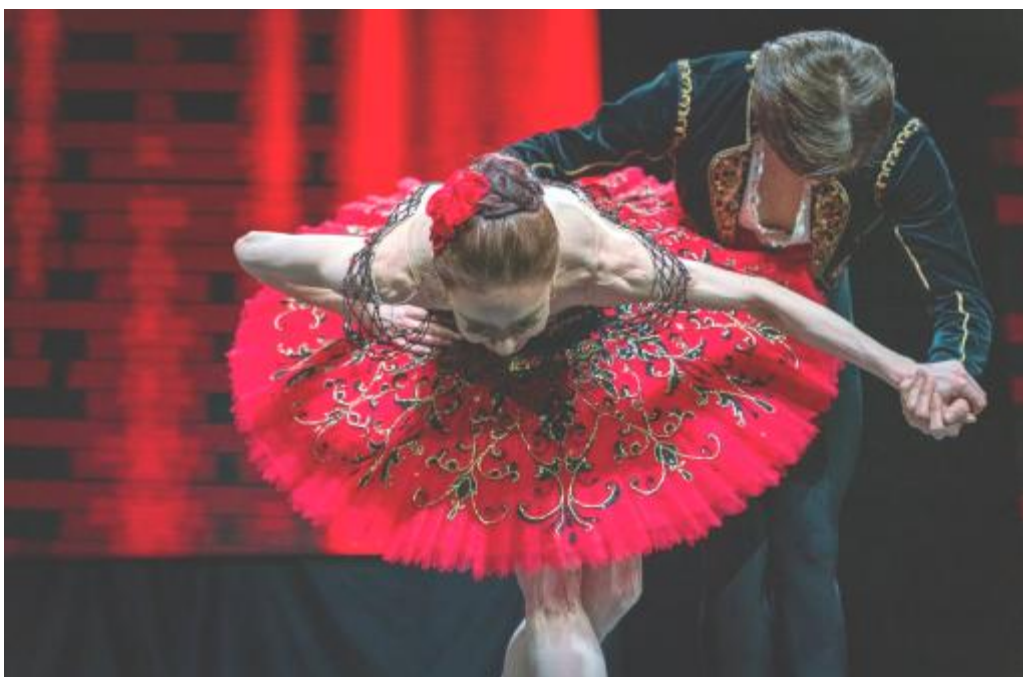
Bailarines del Teatro Bolchoi