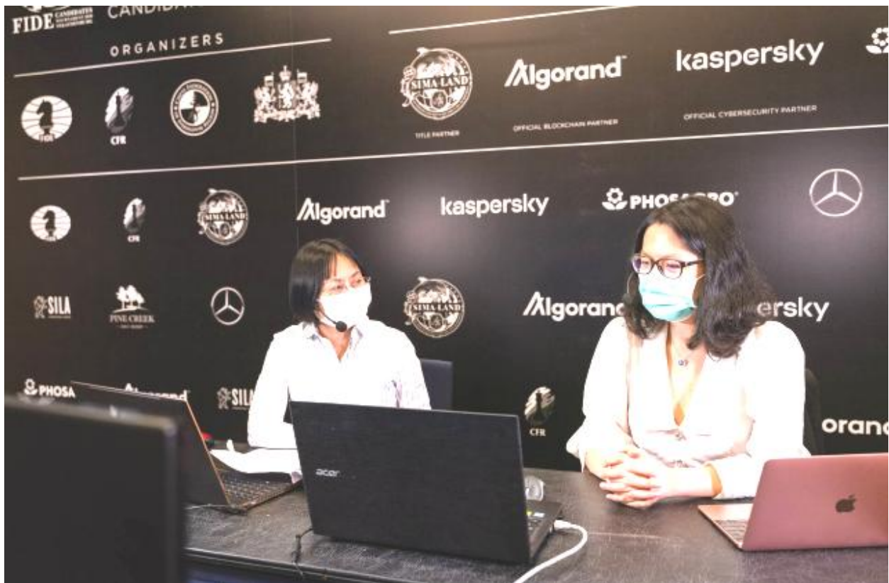
Las dos comentaristas de la retransmisión en chino: a la derecha, Yifán Hou, número uno del mundo; y Zhaoqin Peng

“El ambiente es raro, muy distinto a lo normal en un torneo. En el comedor del hotel, los jugadores están alejados, se aíslan, o evitan bajar y comen en la habitación. Hay muy pocos espectadores porque solo se exige una acreditación especial, y solo pueden entrar en la sala de comentarios, no en la de juego”, reveló el neerlandés Jeroen van den Berg, presidente del Comité de Apelación y supervisor de la FIDE. Todo ello contrasta con lo que Van den Berg ve en la calle: “Casi nadie utiliza mascarilla. Si no supieras previamente que gran parte del mundo se encuentra en estado de alarma, paseando por Yekaterimburgo pensarías que no ocurre nada”. El autor de esta crónica tardará al menos una semana en poder comprobar ese testimonio porque está en cuarentena en su habitación por haber viajado desde España.