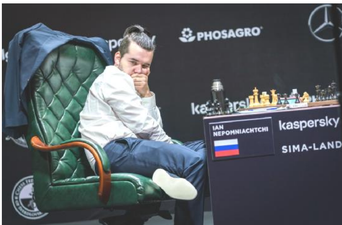
Ian Nepomniachtchi ¿Será el próximo retador al Campeón del Mundo?