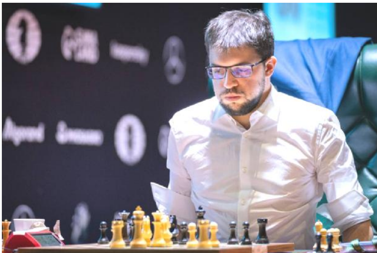
Vachier-Lagrave, durante su partida de hoy con Caruana

Y todo indicaba que iba a ser así. Pero, de pronto, tras casi seis horas de suplicio, el defensor galo se hizo un lío entre los intrincados planes defensivos, aplicó el que no era, y quedó técnicamente perdido, lo que sitúa a Caruana a medio punto de Niepómniachi, muy criticado por Carlsen cuando, con blancas, hizo tablas con el neerlandés Anish Giri tras solo 28 movimientos. “Es verdad que las blancas solo tienen una mínima ventaja, pero si me das esa posición frente a Giri, yo le daría vueltas durante horas”, explicó el noruego.