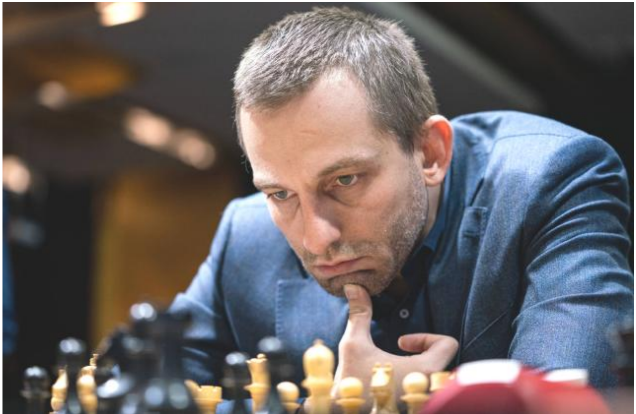
Alexándér Grischuk, durante la partida de este domingo

Grischuk, de 36 años, 5º del mundo, siempre se ha distinguido por hablar muy claro: “Podemos sentir la tensión a nuestro alrededor, con tanta gente con mascarillas en la sede del torneo. Teniendo en cuenta las circunstancias, puedo estar satisfecho de mis resultados hasta ahora [cinco empates]. Pero, si todos los demás deportes han cancelado las grandes competiciones, no entiendo por qué nosotros seguimos jugando”.