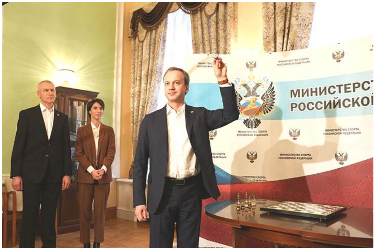
Oleg Matytsin (Ministro de Deportes de Rusia), Anastasia Myskina (ex estrela de tenis y ganadora del French Open 2004) y el presidente de la FIDE, Arkady Dvorkovich

El Torneo de Candidatos se disputará entre el 15 de marzo y el 5 de abril en Ekaterinburgo, Rusia. El torneo se disputará por sistema de liga a doble vuelta. El ganador será el próximo retador al Campeón del Mundo, Magnus Carlsen. El viernes pasado, 14 de febrero, se llevó a cabo el sorteo de los emparejamientos en Moscú. Atendió al acto el presidente de la FIDE, Arkady Dvorkovich. Ahora ya se sabe, quién jugará con quién y en qué fecha y con qué color.