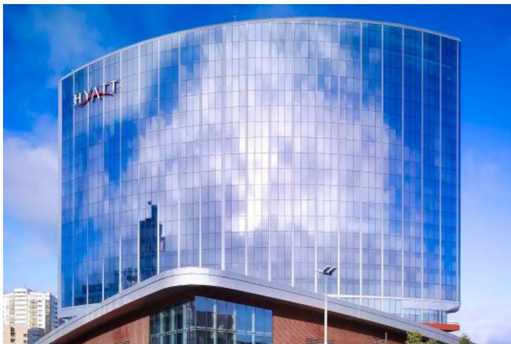
O local do torneio é o Hotel Hyatt Regency em Ecatemburgo, Rússia. É também onde os jogadores ficarão.

>> Se houver dois jogadores empatados em primeiro lugar, um desempate de partidas rápidas e blitz será realizado entre esses jogadores para determinar o vencedor e o segundo colocado.