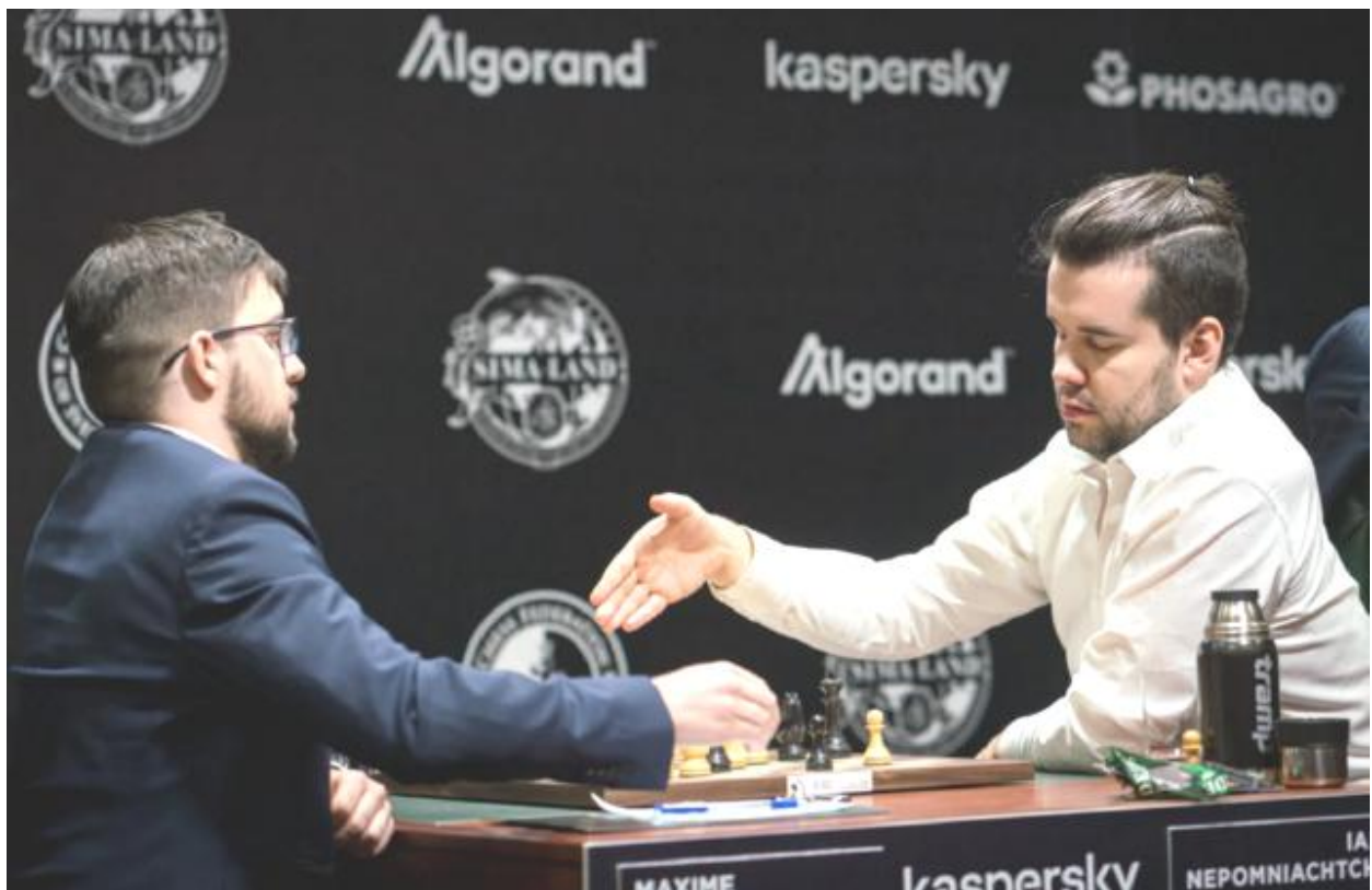
El exacto momento de la rendición de Nepo