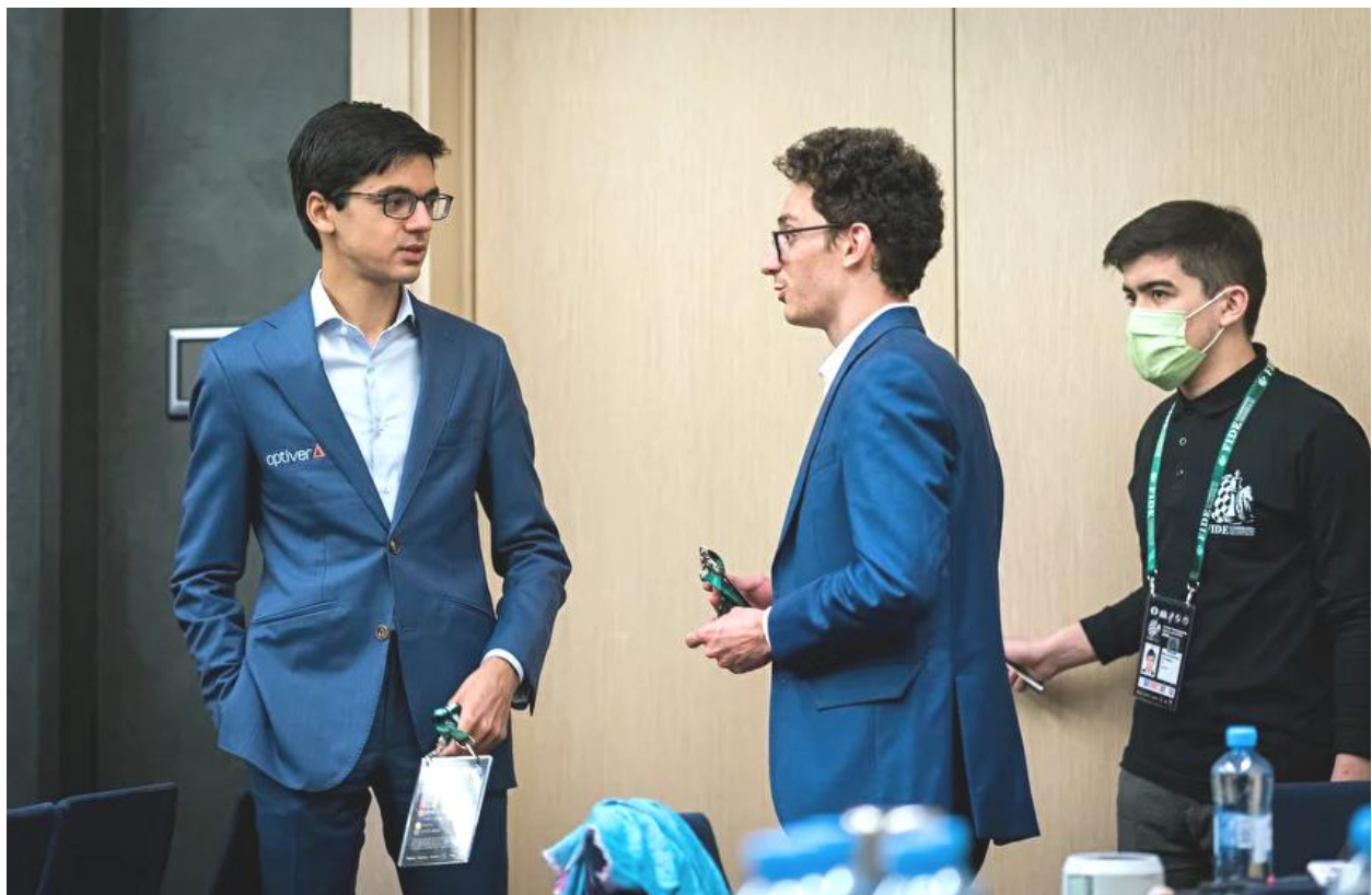
Anish Giri y Fabiano Caruana