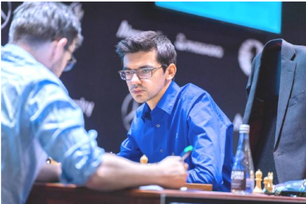
Giri mira a Vachier-Lagrave durante la partida de hoy

Quien sí arriesgó, y mucho, fue Vachier-Lagrave, derrotado por el ruso Alexánder Grischuk en un combate de gran calidad e interés. Preguntados ambos al respecto en la conferencia de prensa, Grischuk defendió la actitud de su rival: “Recordemos, por ejemplo, la 24ª y última partida del 2º duelo Kárpov-Kaspárov, Moscú 1985. A Kaspárov le bastaba el empate para convertirse en el campeón del mundo más joven de la historia. Sin embargo, ganó una de las mejores partidas de su carrera”.