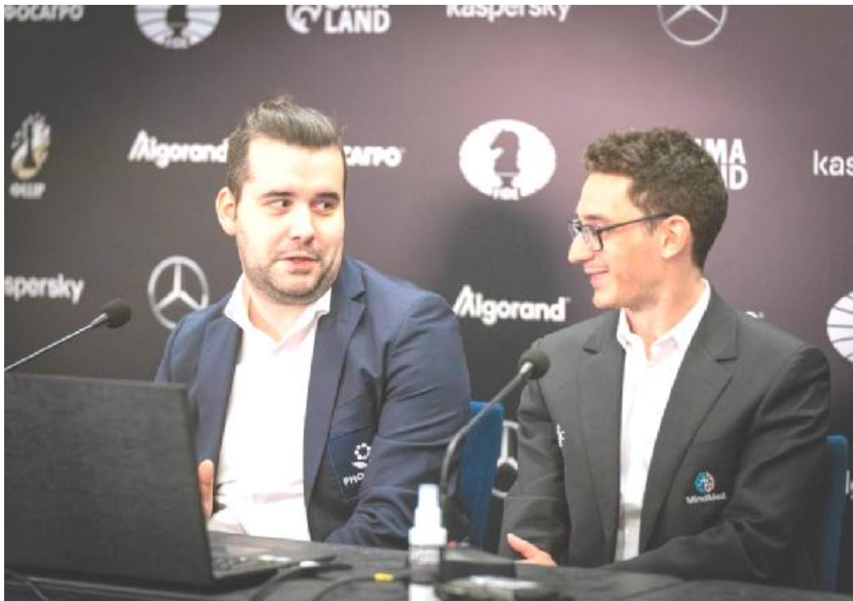
Ian Niepómniachi, a la izquierda, y Fabiano Caruana durante la conferencia de prensa de hoy tras su empate en Yekaterimburgo (Rusia)

Tres aspirantes a falta de tres rondas en el Torneo de Candidatos de Yekaterimburgo (Rusia). El ruso Ian Niepómniachi, el neerlandés Anish Giri y el estadounidense Fabiano Caruana mantienen probabilidades razonables de retar en noviembre al noruego Magnus Carlsen. Sobre todo el primero, con ventaja de medio y un punto, respectivamente, y mejor desempate que Giri. Este ha firmado hoy una victoria brillante sobre el chino Liren Ding mientras Niepómniachi se aseguraba el empate con blancas frente a Caruana, quien se enfrenta el sábado al neerlandés.