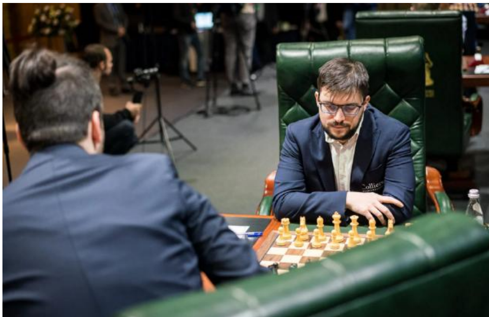
Lagrave antes de que comience el juego

La gran seguridad en sí mismo de Ian Niepómniachi tras seis rondas impecables -líder claro, invicto, muy bien preparado- le llevó a repetir la Defensa Francesa, esta vez ante el francés Maxime Vachier-Lagrave, y ahí estuvo el origen de su derrota. Una idea estratégica muy profunda del galo en la 8ª jugada le dio una posición ganadora 20 movimientos después. Ambos pasan en cabeza el ecuador del Torneo de Candidatos en Yekaterimburgo (Rusia) con un punto más que el principal favorito, el estadounidense Fabiano Caruana, quien se enfrentará en la jornada siguiente a Vachier-Lagrave.