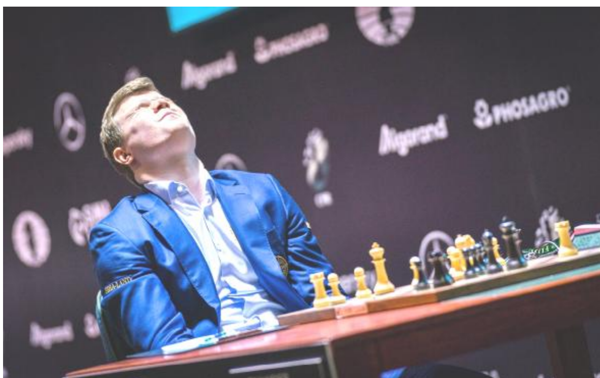
Kirill Alekseenko sufriendo visiblemente

20/04/2021 – En la octava ronda del Torneo de Candidatos 2020/2021, Fabiano Caruana derrotó a Maxime Vachier-Lagrave. Tras más de un año, ayer se retomó la competición aplazada en marzo de 2020 por la crisis del coronavirus. En la partida de ayer, Caruana planteó una agresiva novedad en la Siciliana Najdorf. Alcanzó una posición ligeramente superior en el final de la partida y la convirtió en una impresionante victoria. Kirill Alekseenko derrotó a Alexander Grischuk. Ian Nepomniachtchi firmó tablas con Anish Giri y ha tomado el mando en solitario. Esta tarde, se disputará la novena ronda.