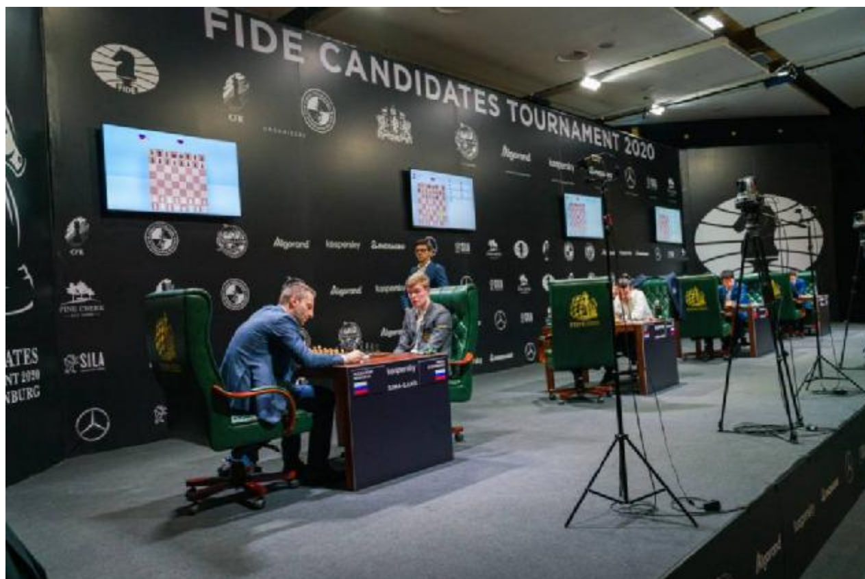
Vista general de la sala de juego en Yekaterimburgo (Rusia) en marzo de 2020

Cuatro de ocho aspirantes tienen probabilidades razonables a falta de siete rondas en Yekaterimburgo