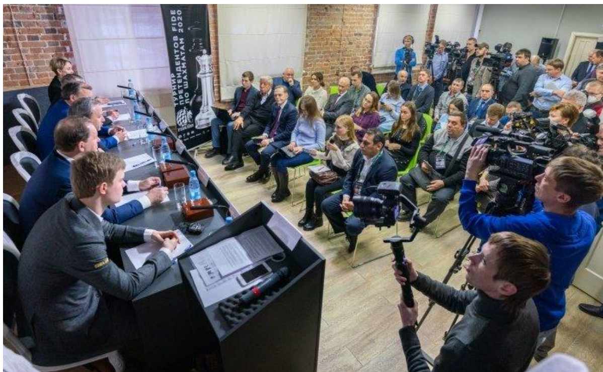
La rueda de prensa