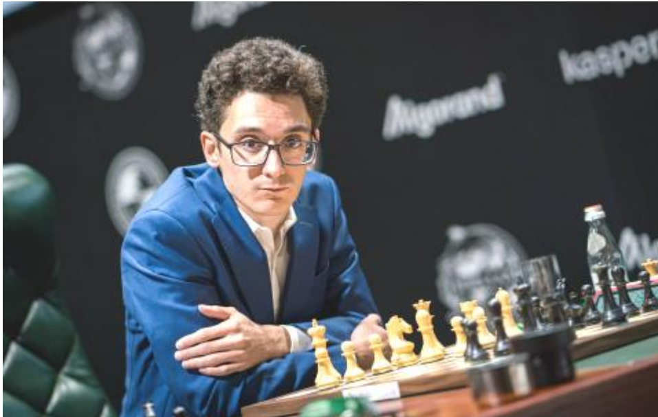
Fabiano Caruana, durante su partida de hoy en el Torneo de Candidatos

El ruso Niepómniachi neutraliza una idea innovadora del estadounidense, que sufre para empatar