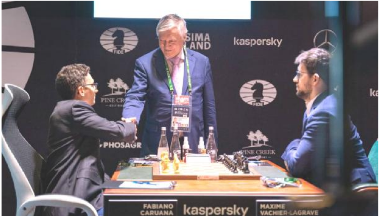
El excampeón Anatoli Kárpov saluda a Caruana antes de realizar el saque de honor, hoy en Yekaterimburgo

El estadounidense tumba a Vachier-Lagrave tras una pelea de seis horas y es 2º tras Niepómniachi