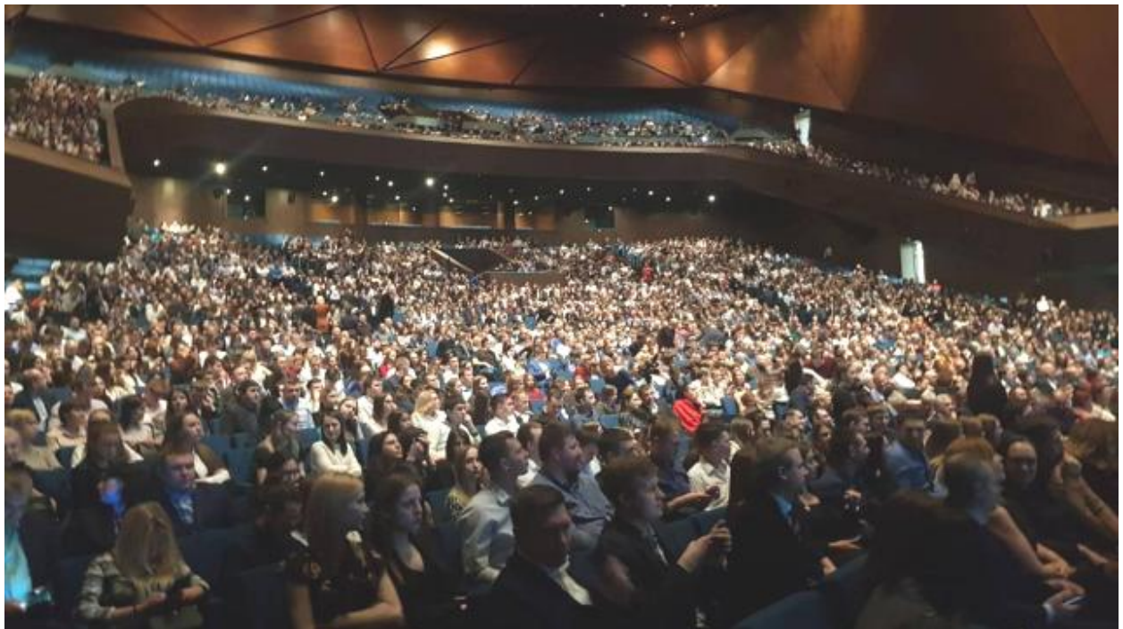
Público, este lunes, en el teatro de Yekaterimburgo donde se celebró la ceremonia de inauguración del Torneo de Candidatos

El lunes, 16 de marzo por la tarde se llevó a cabo la ceremonia inaugural del Torneo de Candidatos en Ekaterinburgo (Rusia). En su discurso, el presidente de la FIDE Arkady Dvorkovich reiteró que el torneo se disputará bajo las máximas medidas necesarias para garantizar la seguridad sanitaria. Durante el acto hubo varios discursos, música clásica y una representación de danzas por las bailarines del Teatro Bolchoi.