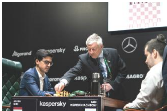
Anatoly Karpov realizando el saque de honor en el tablero de Anish Giri e Ian Nepomniachtchi