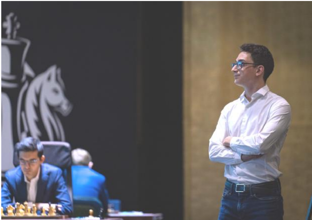
Fabiano Caruana (de pie) y Anish Giri al fondo