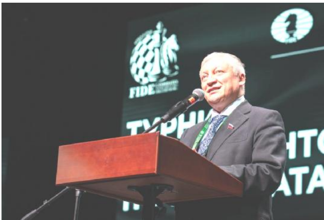
Anatoly Karpov durante su discurso

"Para poder ganar semejante torneo, hace falta mucha energía, salud y tranquilidad. Además son útiles la preparación específica para el torneo y buenos conocimientos de de las aperturas. Los participantes en este torneo han conquistado muchas victorias a lo largo de sus respectivas carreras. Realmente van a participar los mejores ajedrecistas del mundo". Anatoly Karpov