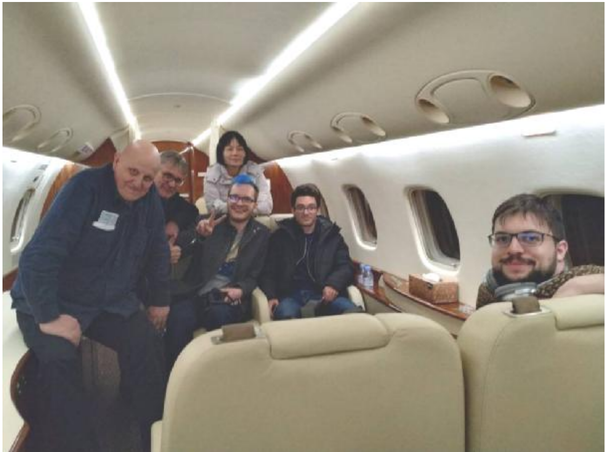
Vachier-Lagrave y Caruana junto a los demás pasajeros del avión privado que los evacuó de Yekaterimburgo el 27 de marzo de 2020

Por fortuna, el homo sapiens, que había sido incapaz de tomar medidas preventivas contra la pandemia a pesar de los avisos, encontró la manera de vencerla poco a poco. Meses después, Caruana y Vachier-Lagrave empezaron a preparar en serio la reanudación del Candidatos, y en especial la importante lucha entre ambos de la 8ª ronda (1ª de la 2ª vuelta).