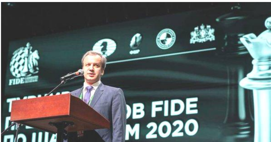
El presidente de la Fide

26/03/2020 – Después de que Rusia anunció cerrar el espacio aéreo ruso, la FIDE tomó la decisión de posponer la segunda mitad del Torneo de Candidatos para permitir a los jugadores, regresar a casa. En un comunicado de prensa del 26 de marzo comunica que "El Presidente de la FIDE ha decidido terminar el Torneo de Candidatos" Continuará más adelante y se espera que dentro de poco se anunciarán las nuevas fechas. El resultado obtenido hasta la séptima ronda sigue siendo válido y el torneo se reanudará donde ha terminado ahora. La octava ronda y el resto del torneo se disputarán de la misma manera, únicamente que será algo más tarde y no ahora.