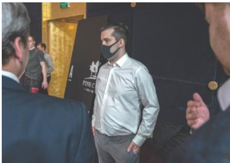
Ian Nepomniachtchi con mascarilla

En el ámbito puramente deportivo, y más allá de que las medidas preventivas sean eficaces o no para reducir el riesgo de infección al mínimo, aparece un factor inédito, y también causado por el coronavirus. ¿Se puede rendir al más alto nivel en el deporte mental por excelencia con gran parte del mundo -incluidas las familias de los jugadores- en estado de alarma? Durante la conferencia de prensa, Kárpov no citó para nada el coronavirus, e hizo este resumen de las cualidades necesarias para ganar un torneo tan selecto: “Energía, salud, nervios en calma, buena preparación de las aperturas [primeros movimientos de cada partida] y un entrenamiento específico para este torneo”. Esta última es la que exige algo sin parangón: aunque el poder de concentración de los ajedrecistas profesionales suele ser a prueba de bombas, está por ver que puedan controlar el miedo a la pandemia, instalado en el subconsciente.