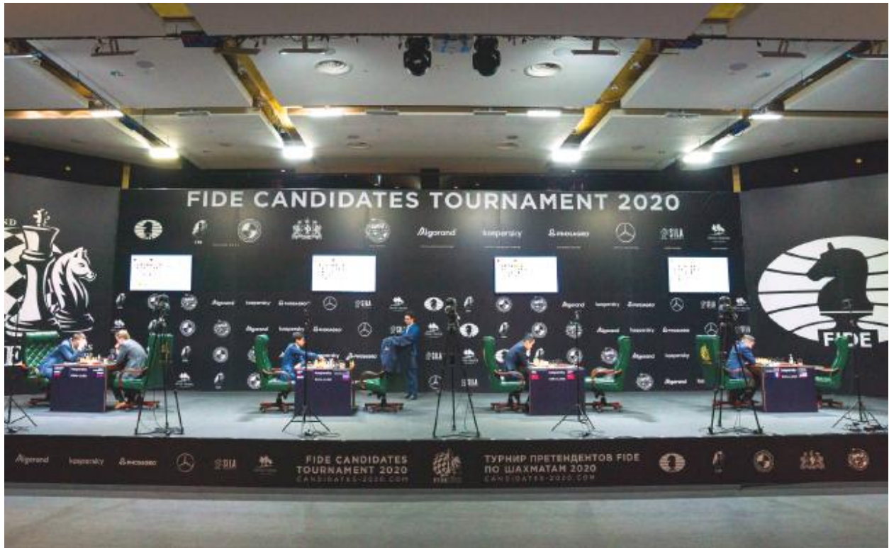
Vista general de la sala de juego, sin público, del Torneo de Candidatos en Yekaterimburgo

Un juego que enseña a pensar es muy útil ante un mundo cambiante, veloz y con nuevos enemigos