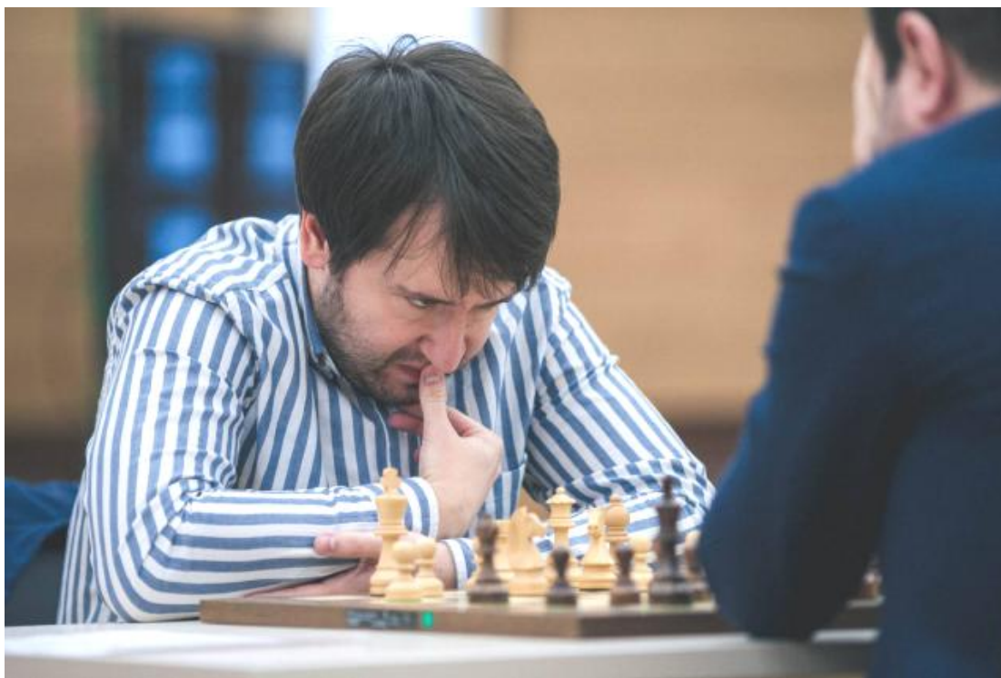
Teimur Radjabov piensa una jugada durante la Copa del Mundo el pasado septiembre en Janti Mansiisk (Rusia)

Finalmente Radjabov explica que, por todo ello, pidió un aplazamiento a la FIDE, que lo ha rechazado. Dado que esa incertidumbre podría afectar a su nivel de concentración, así como a su salud, él mantuvo su petición, y la FIDE ha optado por sustituirlo por Vachier-Lagrave.