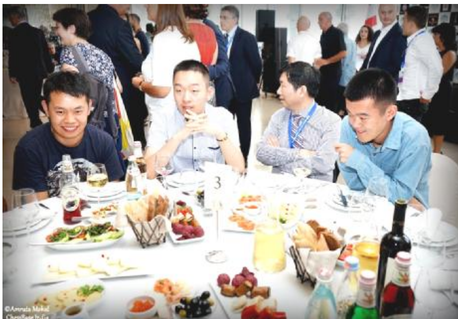
Al ser de los mejores jugadores del mundo, Wei Yi y Ding Liren a menudo tienen que enfrentarse en el tablero, pero fuera de él, son buenos amigos

SS: ¿Entonces estás contento con esa evolución?