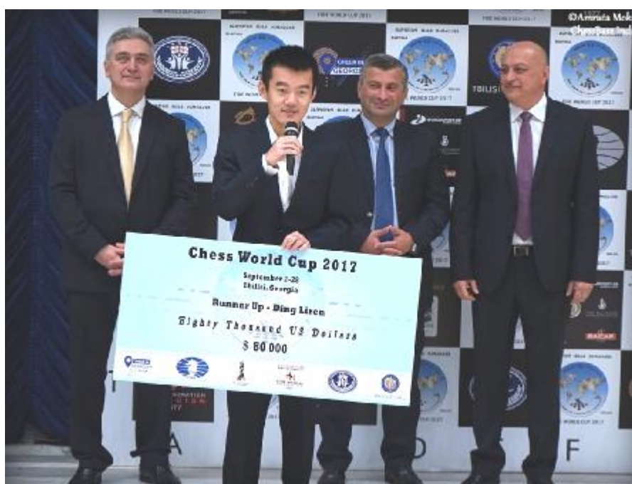
Ding Liren tras recibir el cheque de subcampeón (del que hay que deducir el 20% de comisión de la FIDE) en la ceremonia de clausura

DL: Tras deducir el coste de la habitación, quedarán en 60.000 USD. Es una buena suma. Se la daré a mi madre, como hago siempre.