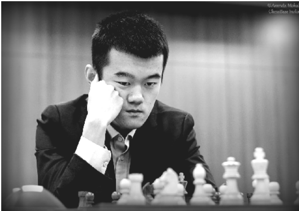
El número 1 de China y clasificado para el Torneo de Candidatos 2018

04/10/2017 – Finalista de la Copa del Mundo, Ding Liren ajedrecista es bien conocido por todos. ¿Pero qué hay de Ding Liren como persona? No se sabe mucho de su vida privada, su educación, sus gustos y fobias, aficiones, novia, rutinas diarias, objetivos de cara al futuro y todo eso. Con la intención de llenar ese vacío, el MI Sagar Shah se reunió con Ding al finalizar la Copa del Mundo 2017 y le hizo una entrevista. Las respuestas del ajedrecista chino muestran el tipo de persona que es: sus pies pisan firmemente el suelo, pero su mente piensa en grande y apunta alto, ¡muy alto!