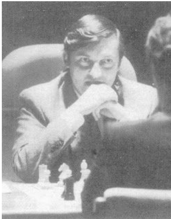
La famosa mirada asesina de Karpov. Toda la violencia de una partida de ajedrez concentrada en un instante.

Pero quien mejor definió el estilo de juego de Karpov fue Kramnik el día que comentó la partida que perdió contra él en el torneo de Linares, 1994: “Yo tenía un final un poco inferior al de él, pero nada de que alarmarse y después de hacer las jugadas normales, no sé como estaba en una posición de derrota. Admito que después de la partida no podía entender que había pasado y eso que estaba en el top ten. Fue una de esas partidas en las que me sentí un idiota, como si no supiera nada de ajedrez. Eso es algo que muy raramente ocurre a los jugadores de elite, pues por lo menos uno es capaz de reconocer las razones de la derrota. Estas partidas son difíciles de describir. Hay algo en ellas que no se puede entender, una especie de espíritu karpoviano.”