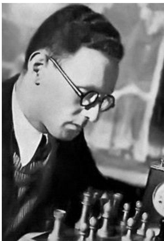
Botvinnik: la mano que mecía la cuna de Karpov.

A los 9 años de edad Anatoly consiguió el primer puesto y se convirtió en el campeón de la región de Chelyabinsk. Enseguida cosechó otros éxitos, pero fue con 15 años cuando se convirtió en Maestro de la URSS, y un año después ya obtuvo la norma de Gran Maestro. Gran parte de la “culpa” de este éxito la tuvo el Campeón del Mundo Mihail Botvinnik, un genio de la estrategia y de la evaluación posicional. De ahí también, además de la lectura de numerosos libros de Capablanca, el estilo sencillo de planes cristalinos de sus partidas. Una sencillez que en realidad es de una gran complejidad.