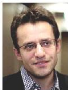
Levon Aronian World No.7