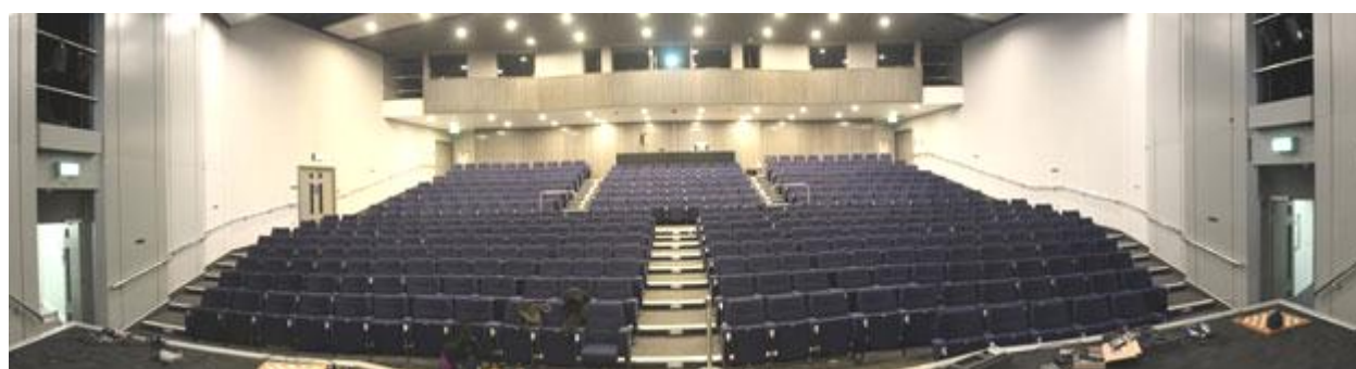
La vista panorámica desde el escenario