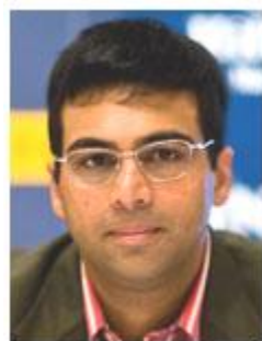
Vishy Anand Former World Ch.