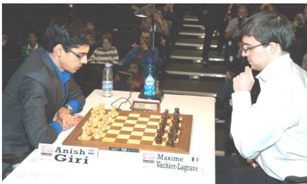
Los desempates Giri vs. Vachier-Lagrave

El ganador se iba a ver las caras en otro duelo con Magnus Carlsen (primero lugar), respectivamente. En el caso de que Vachier-Lagrave hubiese ganado ambas partidas, también habría sido necesario un duelo entre Vachier-Lagrave y Carlsen para determinar al vencedor del Grand Chess Tour.