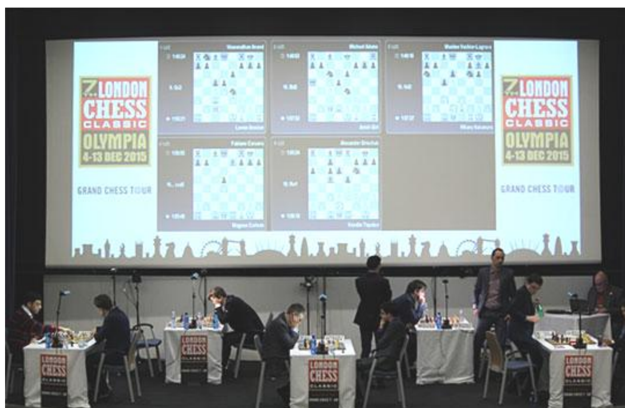
Los jugadores toman sus asientos para el inicio de las partidas.