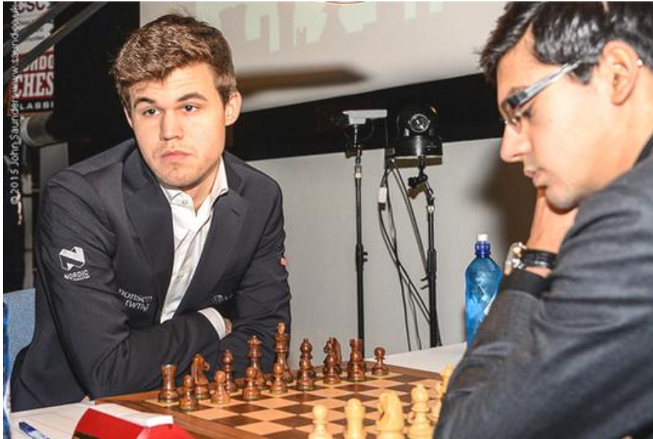
Carlsen y Giri

Anish Giri pasa por ser un jugador muy sólido y evitaba correr riesgo alguno en su partida contra Magnus Carlsen. Carlsen jugaba con negras y optó por la Española. En el medio juego, a pesar de sus esfuerzos no consiguió desequilibrar la posición. Finalmente la partida devino en un final de damas con alfiles de colores opuestos y tras 53 movimientos se firmaron las paces.