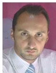
Veselin Topalov World No.2