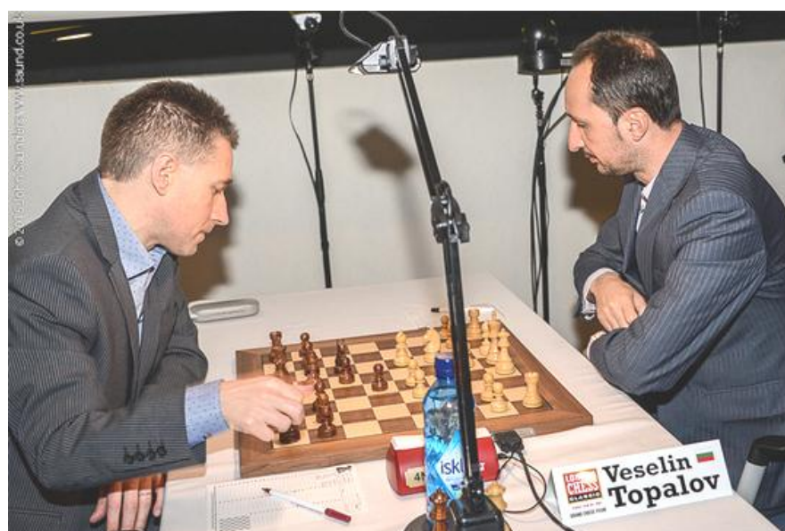
Adams y Topalov

Veselin Topalov hasta ahora no ha tenido mucha suerte Londres. En la partida contra Michael Adams, en un gambito de Dama con Af4, Topalov tomó la iniciativa en el medio juego y tras una imprecisión por parte de Adams ganó calidad. Pero Michael tuvo cierta compensación. Topalov optó por devolver el caballo para poder atacar al rey negro que estaba expuesto al peligro, pero tras una defensa con mucha sangre fría de Adams, Topalov tuvo que darse cuenta de que no había conseguido más que unas tablas contra el inglés.