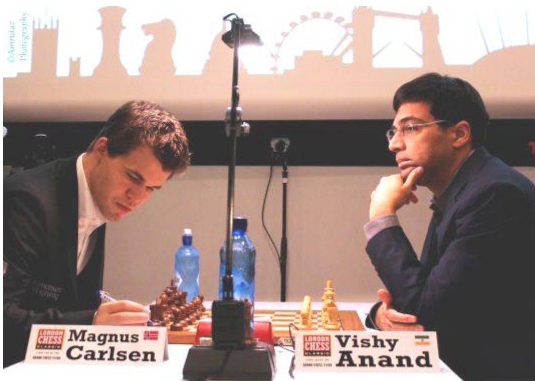
Anand y Carlsen nuevamente discutieron la defensa Berlinesa

Alexander Grischuk estaba a punto de jugar una partida gloriosa contra la defensa Berlinesa. En una posición estratégica absolutamente ganada, fue el factor del tiempo el que le complicó la vida como suele ocurrir muy a menudo. Finalmente Anish Giri se escapó con unas tablas. Anish Giri sigue en cabeza de la clasificación, ahora con la misma cantidad de puntos que Maxime Vachier-Lagrave que logró imponerse a Veselin Topalov. En el duelo de estadounidenses, Caruana parecía que iba a ser el ganador durante mucho tiempo. Un peón de ventaja sin compensación alguna no le bastó para apuntarse la victoria.