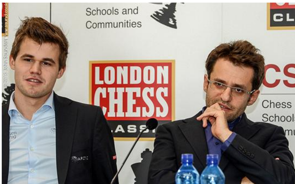
Carlsen y Aronian en la rueda de prensa

Levon Aronian y Magnus Carlsen ya se habían planteado unas cuantas partidas dramáticas a lo largo de sus carreras. Pero su encuentro en la quinta ronda del Chess Classic en Londres más bien carecía de espectáculo y concluyó en tablas. El quinto empate en este torneo para ambos. Aronian evitó la continuación más agresiva en el movimiento 15 y después la posición se puso cada vez más igualada y concluyó en tablas tras 40 minutos.