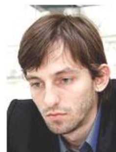
Alexander Grischuk World No.14