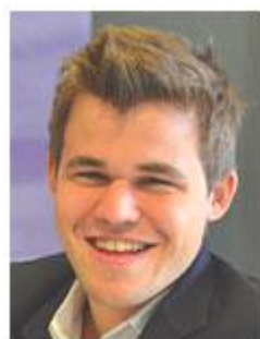
Magnus Carlsen World Champion