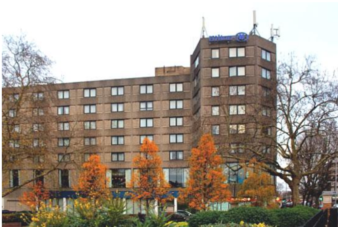
El Hotel Hilton de cinco estrellas en Londres que alojará a los ajedrecistas. La sala de juego está a tan solo 200 metros de distancia.