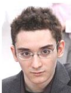
Fabiano Caruana World No.6