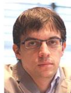
Maxime Vachier-Lagrave World No.12

El VII Chess Classic de Londres, el mejor torneo de Inglaterra, se disputará en el Centro Olímpico de Kensington entre el viernes 4 y el domingo 13 de diciembre de 2015. El torneo principal será el más fuerte disputado en Gran Bretaña. Será una competición a nueve rondas con 10 participantes. El control de tiempo es de 40 movimientos en 2 horas, seguido de una hora más para el resto de la partida, con un incremento de 30 segundos por jugada a partir del movimiento 41.