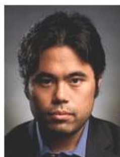
Hikaru Nakamura US Number 1