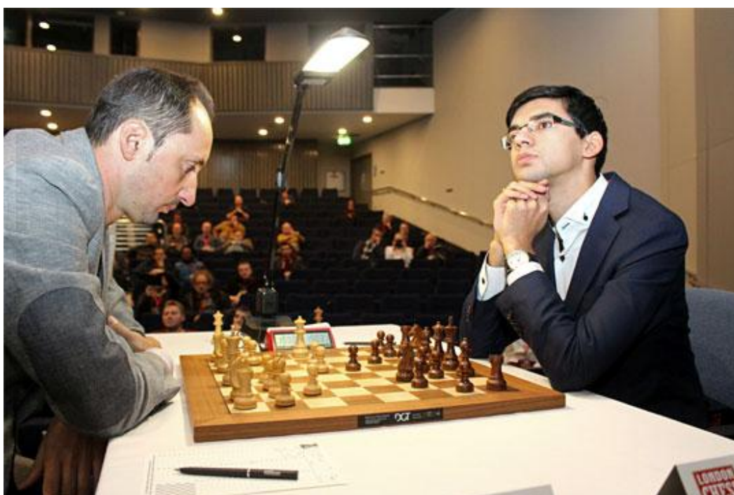
El juego más emocionante del día fue sin duda Veselin Topalov contra Anish Giri. En la imagen superior se puede ver Anish tratando de recordar su análisis después de Topalov juega 5.Qa4 en el sólida variación de Grunfeld.

Alexander Grischuk casi fue víctima de un contragolpe similar después de jugar mal el Berlinesa con el blancas, pero Hikaru Nakamura no logró llevar el punto para casa. Maxime Vachier-Lagrave tuvo ningún riesgo con blancas contra el Sveshnikov de Magnus Carlsen y optó por un empate rápido mientras Michael Adams, que estaba jugando con Negras contra Vishy Anand, no tuvo problemas para neutralizar el apertura Inglesa de Anand. El juego entre Fabiano Caruana y Levon Aronian ofreció más emoción, pero también terminó en tablas después de 51 movimientos.