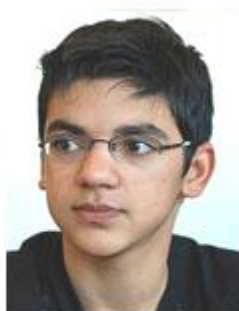
Anish Giri World No.9