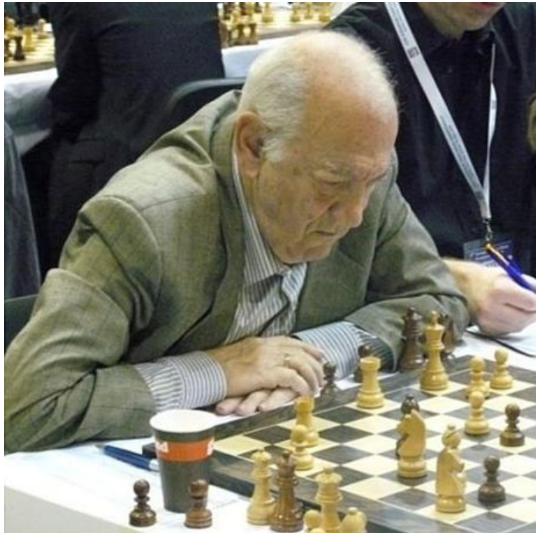
Victor Korchnoi, um grande mestre de 83 anos