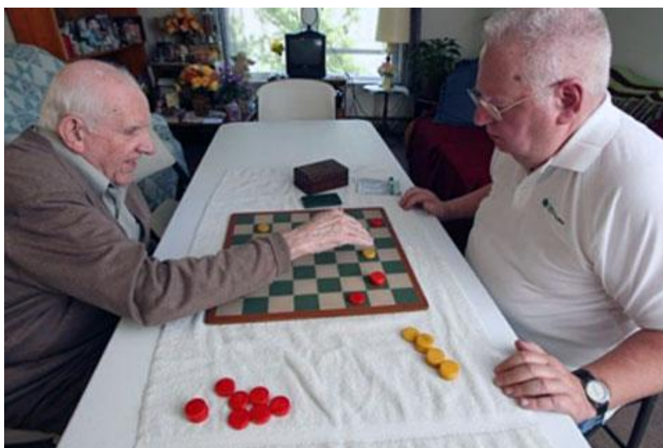
Los resultados del entrenamiento del cerebro pueden tener efectos positivos durante años. Las partidas clásicas de ajedrez son ejercicios muy apropiados para mantener en forma las neuronas.

El dedicarse a los juegos de la mente puede frenar e incluso recuperar funciones del cerebro que se relacionan con el proceso del envejecimiento, según demuestra una serie de estudios. Yo he escrito sobre mis observaciones a la hora de dar clases a las personas mayores y cómo han mejorado sus capacidades cognitivas gracias a los deportes de la mente y los avances en la ciencia que está estudiando la funciones críticas del envejecimiento del cerebro.