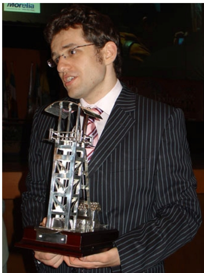
En 2008, Aronian ganó el Torneo Magistral Ciudad de Linares