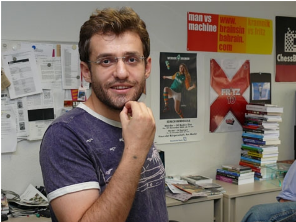
Aronian de visita en la oficina de ChessBase en Hamburgo

Aronian es uno de los tres jugadores que son los únicos que han conquistado el título del Campeón del Mundo tanto en la modalidad de ajedrez relámpago como en la de ajedrez rápido (los otros dos son Anand y Kasparov), y también se ha alzado con el título del Campeón del Mundo de Ajedrez 960 (también llamado "ajedrez Fischer" o "ajedrez aleatorio")